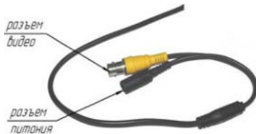
Схема внешних подключений