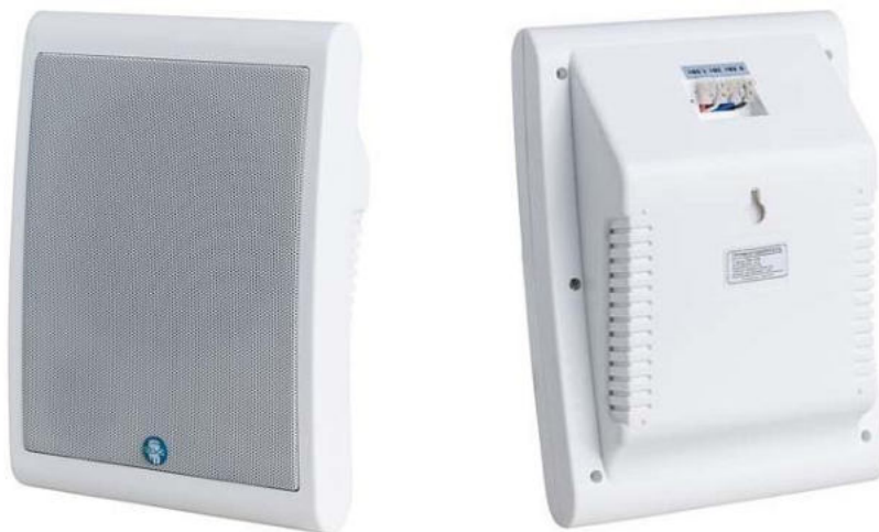
Рис. 1. Внешний вид громкоговорителя.

Внешний вид громкоговорителя показан на рис. 1.