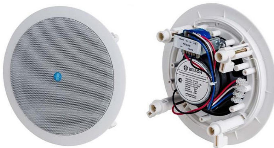
Рис. 1. Внешний вид громкоговорителя.

Внешний вид громкоговорителя показан на рис. 1.