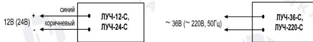
Рис.1. Схемы подключения.

4.3. По окончании монтажа необходимо произвести внешний осмотр и убедиться в отсутствии повреждений корпуса и проводов.