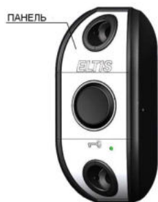
Рис.1 Внешний вид изделия

На рис.1 представлен внешний вид изделия, на рис.2 – схема подключения, на рис.3 показан внешний вид изделия с козырьком, на рис.4 – разметка под установку.