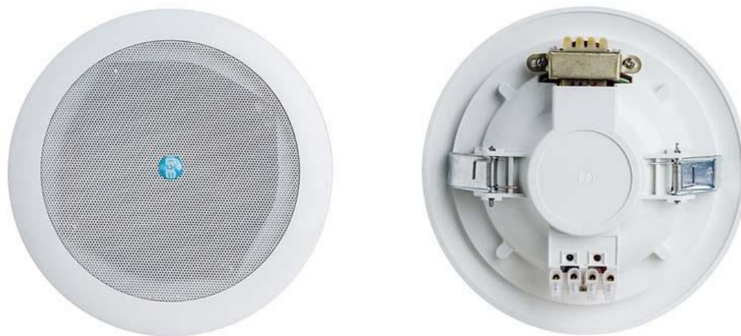
Рис. 1. Внешний вид громкоговорителя.

Внешний вид громкоговорителя показан на рис. 1.