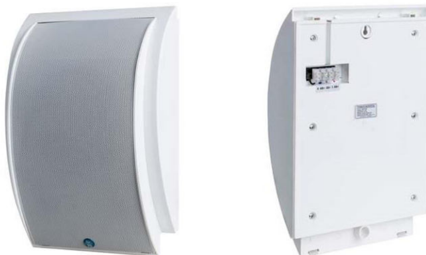
Рис. 1. Внешний вид громкоговорителя.

Внешний вид громкоговорителя показан на рис. 1.